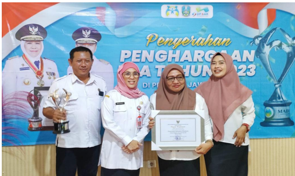
FOTO PENGHARGAAN KLA MADYA